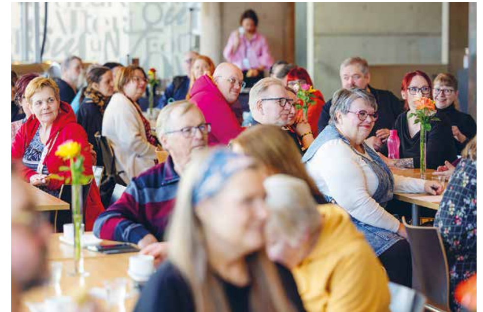
Asukastoimijoiden kevättapahtuma pidettiin tällä kertaa hotelli Lasaretin sijaan Oulun teatteriravintolassa.

Vertailussa yhdeksän suurimman kaupungin kesken Oulun vuokrat ovat selvästi edullisimmat. Vuokrat olivat viime vuonna 18,7 prosenttia alemmat kuin markkinavuokrat. Keskivuokra oli vuoden 2025 lopussa Oulun Sivakalla 11,88 euroa neliötä kuukaudessa ja Sivakka-yhtymällä 12,17 euroa kuukaudessa.