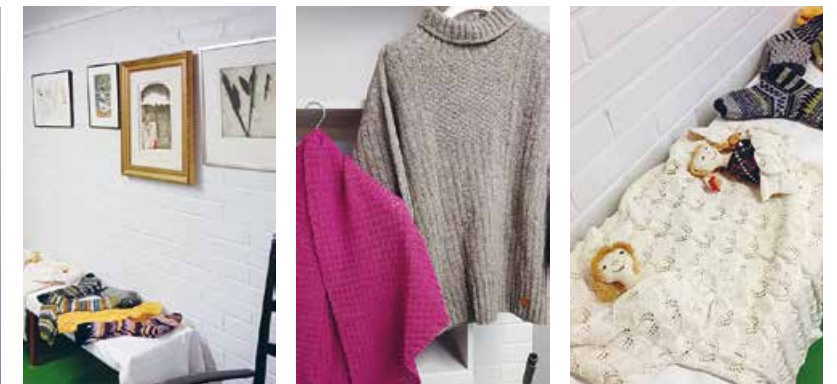
Tuiran Valtatien kerhotilan asukkaiden kädentöiden näyttelyn antia.